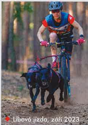
♦ Líbová jízda, září 2023

Po pár trénincích a jednom víkendovém kempu slovo dalo slovo a já pro ně začal fotit závody. Úplně mě dostala ta atmosféra, kde na rozdíl od svateb nemusím do focení nikoho přemlouvat nebo nutit, a naopak mi ještě někteří zamávají nebo aspoň nahodí