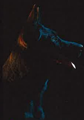
♦ Jedna z oblíbených fotografií: Hry se světly

Z vlastní zkušenosti – focení mé smečky u tebe v ateliéru – vím, že dokážeš u psů vykouzlit úsměv a všichni vypadají na tvých fotkách skvěle. Jak to děláš? Celé kouzlo „usměvavých“ psů tkví v mém citu pro zvířata. Jednoduše vím, kdy a jak jejich pozornost upoutat a jaké triky pro to využít. V doslova „sterilních“ podmínkách v ateliéru je získání pozornosti pejska poměrně snadná záležitost, když je na ně člověk