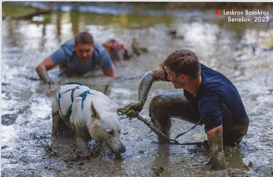
♦ Leskros Botakros Benešov, 2023