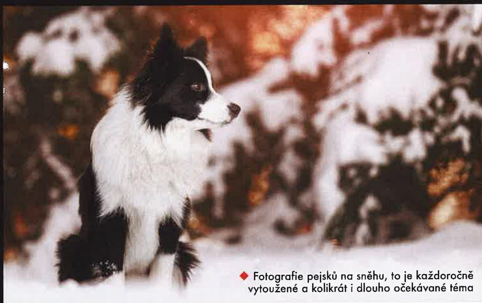
◆ Fotografie pejsků na sněhu, to je každoročně vytoužené a kolikrát i dlouho očekávané téma

Kde tě čtenáři najdou a jaké nabízíš služby? Osobně se nyní nacházím na Vysočině, v blízkosti Náměšti nad Oslavou. Nadále však cestuji po celé České republice, i do zahraničí, na fotografování pejsků, ale i koní. Mých, potažmo našich, společných služeb, které nabízíme s kolegy fotografy, tedy mohou majitelé pejsků využít prakticky kdekoli v rámci Evropy. A jak už jsem zmínila, výuka fotografování koní ( www.jakfotitkone.cz ), které jsem se věnovala a nadále budu věnovat, bude v tomto roce rozšířena i o výuku fotografování psů. Její součástí budou oblíbené taháčky pro fotografy, elektronické knihy plné praktických tipů a triků, zároveň již nyní vzniká i kniha v tištěné podobě, k dispozici budou krátká výuková videa, která teď také připravuji, i ucelený videokurz a mnoho dalšího. A ať si mě řádky právě teď čte majitel pejsků či fotograf pejsků, již teď se těším na naše společné setkání, při kterém si užijeme spoustu legrace a vytvoříme společně „o chlup lepší fotografie“. Jdeš do toho se mnou?